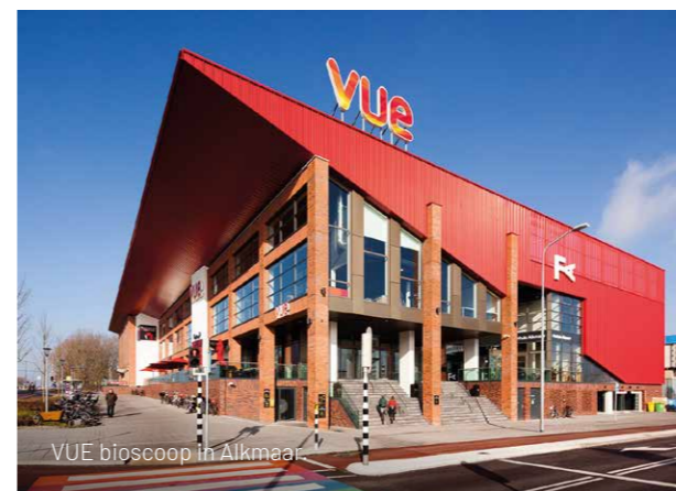
Vue bioscoop in Alkmaar