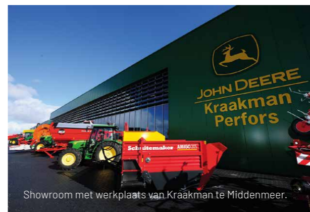
Showroom met werkplaats van Kraakman te Middenmeer.