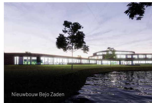
Nieuwbouw Bejo Zaden